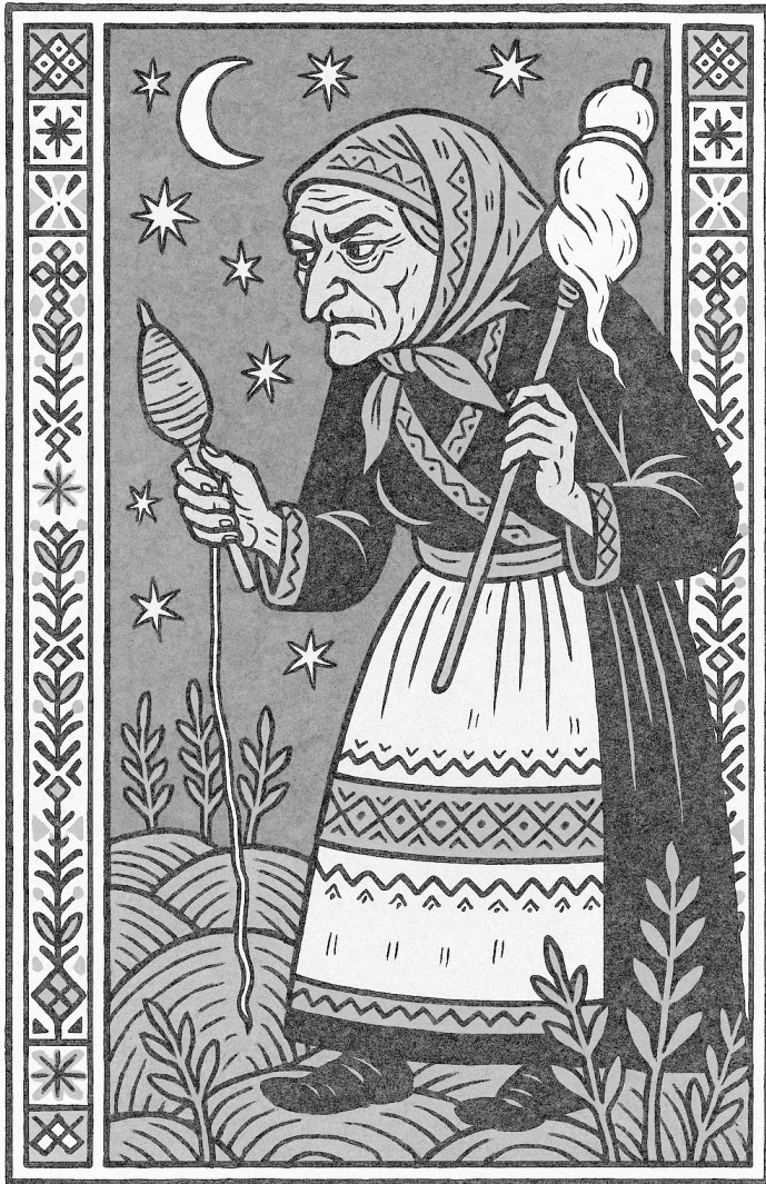
Marțoala, personificarea românească feminină a planetei Marte. Ilustrație ChatGPT.