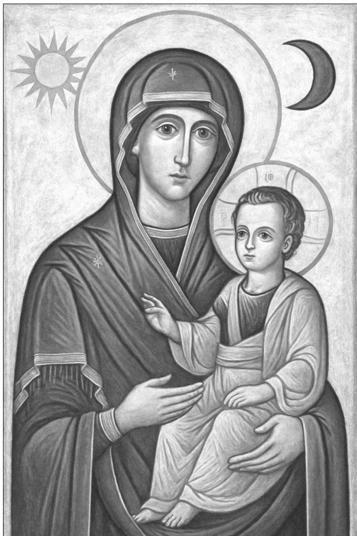
Maica Domnului și pruncul Iisus: Luna și Soarele. Ilustrație ChatGPT.