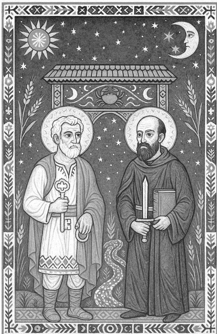
Petru și Pavel: doi Gemeni spirituali, dar cu trăsături contrastante – ca ziua și noaptea, Soarele și Luna. Poarta maramureșeană din fundal marchează tranziția spre zodia Rac. Ilustrație ChatGPT.