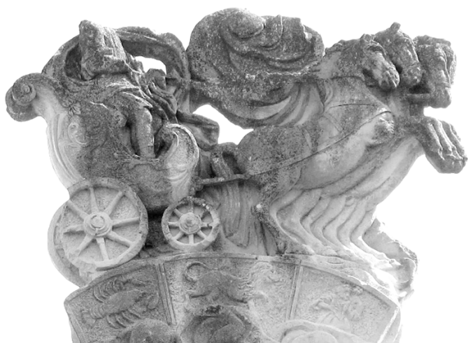
Carul solar și zodiile verii la Bonțida (jud. Cluj).